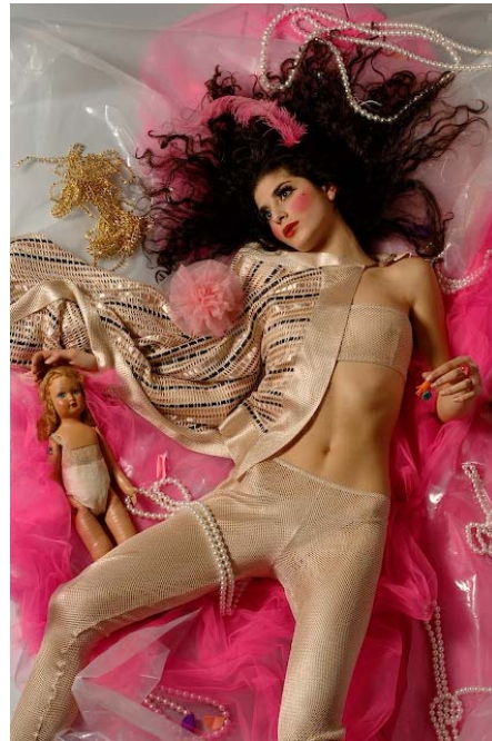
“DOLLS” by Stretch Couture

Progetto ed Organizzazione a cura di: fivegraphic srl www.italianfoodandfashion.com